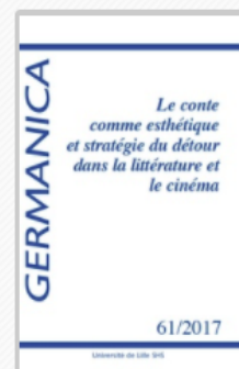
GERMANICA Le conte comme esthétique et stratégie du détour dans la littérature et le cinéma 2017/2 n° 61