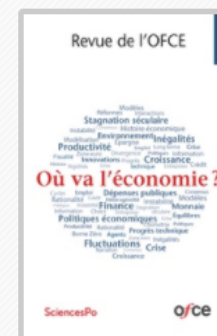
REVUE DE L'OFCE Où va l'économie ? 2017/4 N° 153