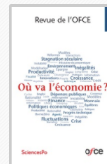
REVUE DE L'OFCE Où va l'économie ? 2017/4 N° 153