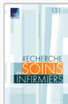
RECHERCHE EN SOINS INFIRMIERS Décembre 2017 2017/4 N° 131