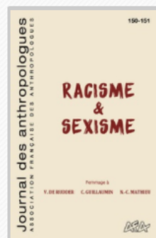
JOURNAL DES ANTHROPOLOGUES Racisme et sexisme 2017/3 n° 150-151